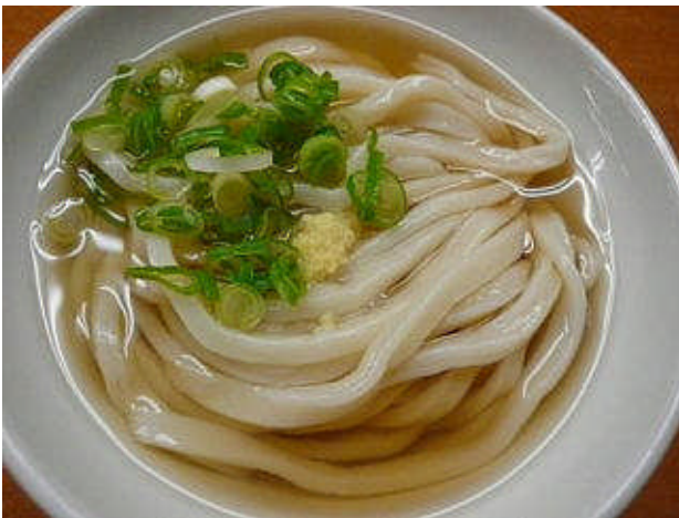
シンプルだがうま〜い☆☆☆

若い御主人ながら、手でうどん粉を練り、機械ではなく手切りでうどんを切ると、こだわっているお店でした。