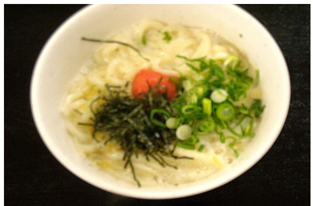
家でもできそう 釜玉明太♪