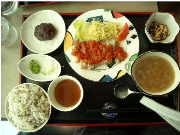
週替わりサービスランチ 850 円

南あわじ市湊、ショッピングセンターシーパ内にある雑穀レストラン Miiiet marche Sola (ミレット マルシェ ソラ) に行ってきました。